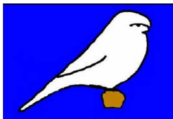
Classes 25 e 50

TPE ou com Marcas (menos de 25% amarelo)