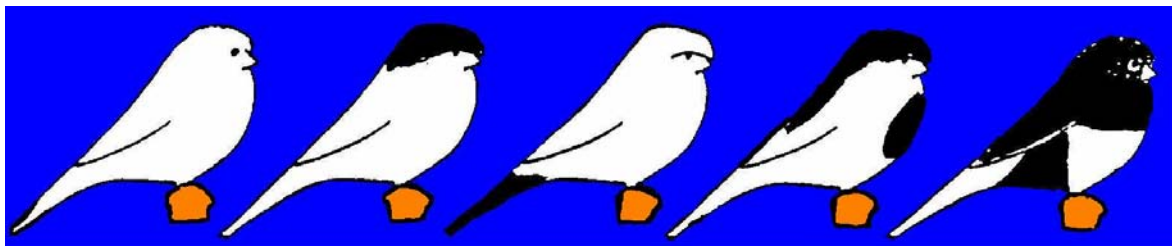
Classes 1 a 8 e 26 a 33

Os casos não previstos são resolvidos por decisão da comissão organizadora tendo em conta o disposto na lei geral Portuguesa.