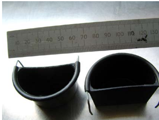
bebedouros, de cor preta e semicirculares