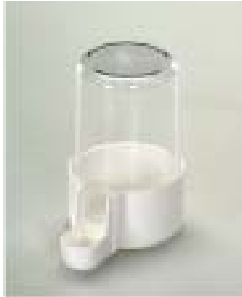
bebedouro sifone curto Mix cc 45 diâmetro com 3,5*6,2